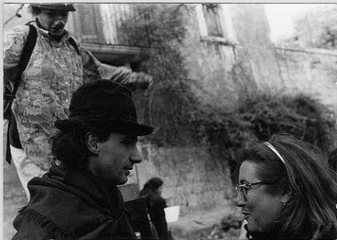
manifestazione largo Omodeo