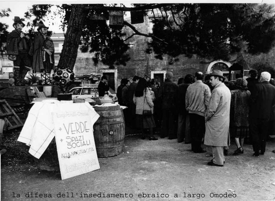
la difesa dell'insediamento ebraico a largo Omodeo